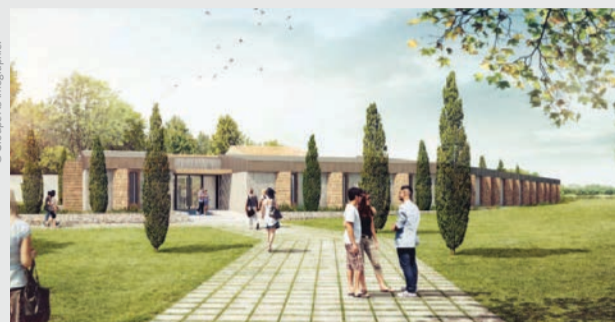
La Ferme du Boisniard, résidence pour accueillir notamment les visiteurs du Puy du Fou

C'est pour compléter l'offre haut de gamme de l'hôtel Château Boisniard que les propriétaires de cet établissement ont décidé de construire une résidence de tourisme.