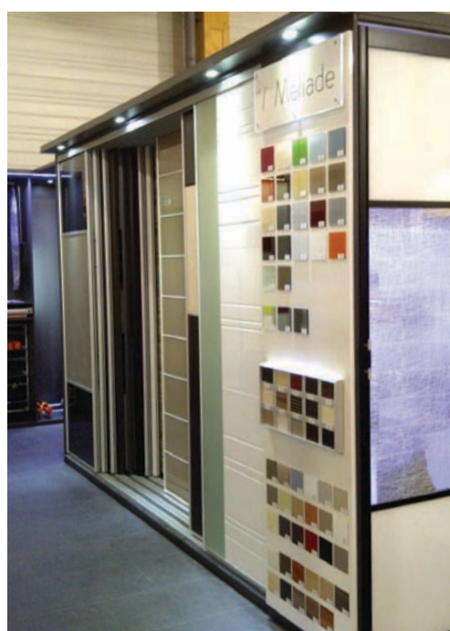
Porte suspendue montée sur pivot