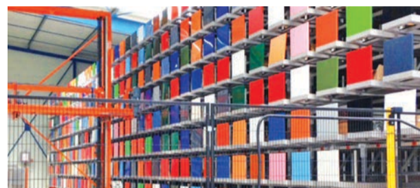
Installation d'un transtockeur, exemple d'investissement prévu dans le nouveau bâtiment.

La société Thermolaquage de Vendée (TLV) est spécialisée dans l'application de peinture sur des profilés aluminium. Sa clientèle est constituée principalement d'industriels de la menuiserie, secteur d'activité d'importance en Vendée, et dans le Grand Ouest plus généralement.