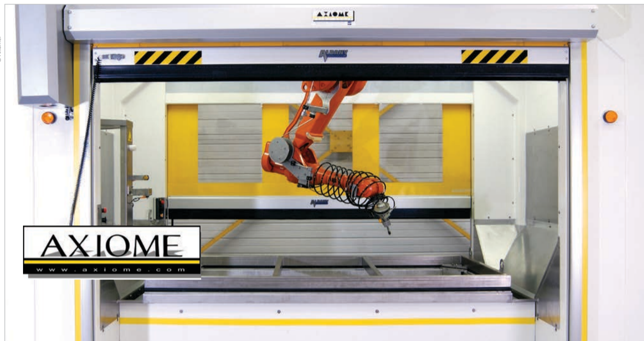
Axiome propose des solutions robotisées sur mesure pour toutes les industries.

Société d'ingénierie créée en 1987, Axiome conçoit et réalise des machines robotisées spécifiques pour toutes les industries : automobile, aéronautique, agroalimentaire, ... Implantée à Aizenay, l'entreprise réalise aujourd'hui 60 % de son chiffre d'affaires à l'export.