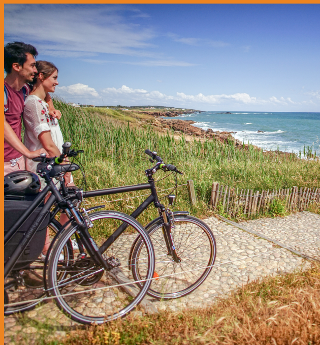
La Vélodyssée