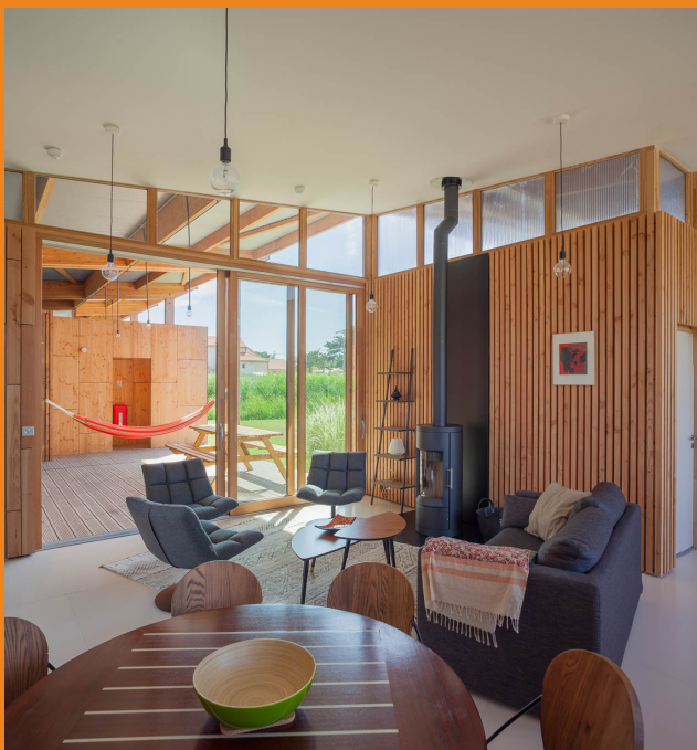
Ecolodge La Ferme du Marais Girard